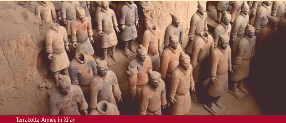
Terrakotta-Armee in Xi'an