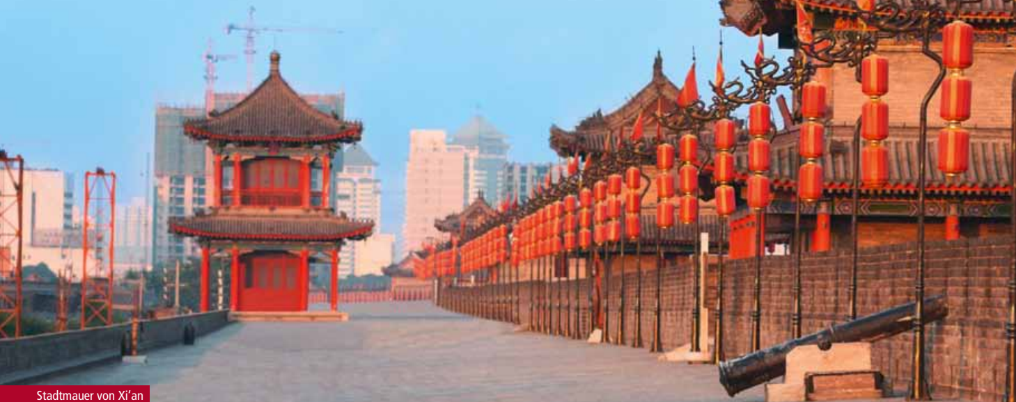
Stadtmauer von Xi'an

Erkunden Sie mit uns das faszinierende Reich der Mitte. Erleben Sie die rasant wachsende Metropole Shanghai, EXPO Stadt von 2010, und Peking, zugleich moderne Olympia- und alte Kaiserstadt. Genießen Sie die beeindruckenden Flusslandschaften des Yangtze und den gigantischen Staudamm während der Flusskreuzfahrt auf Ihrem Premium Schiff. Entdecken Sie China, das Land des Yin und Yang, des Buddha, Laotse und Konfuzius.